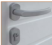
Venkovní madlo se zámkem