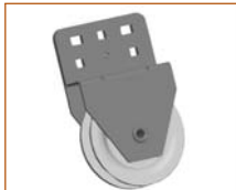
Systém ručního zdvihu HKU1